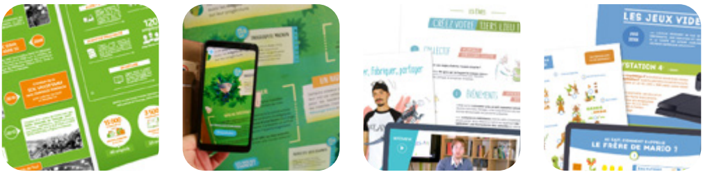
CLIQUEZ SUR LES IMAGES POUR VOIR NOS RÉFÉRENCES !