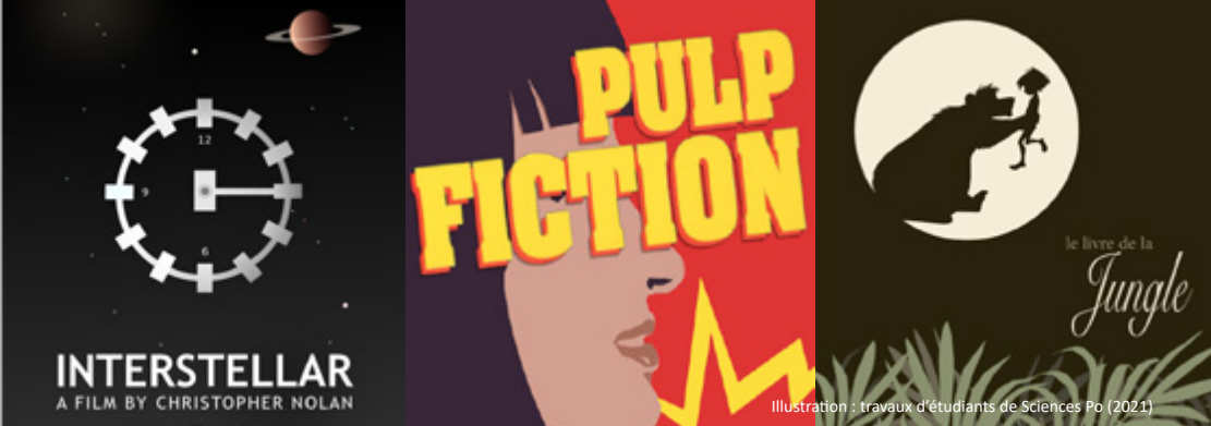
Illustration : travaux d'étudiants de Sciences Po (2021)