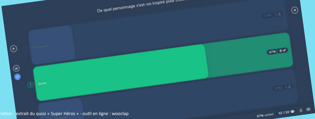
Illustration : extrait du quizz « Super Héros » - outil en ligne : woodlap